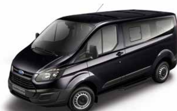
טוניט custom בסיס גלגלים קצר